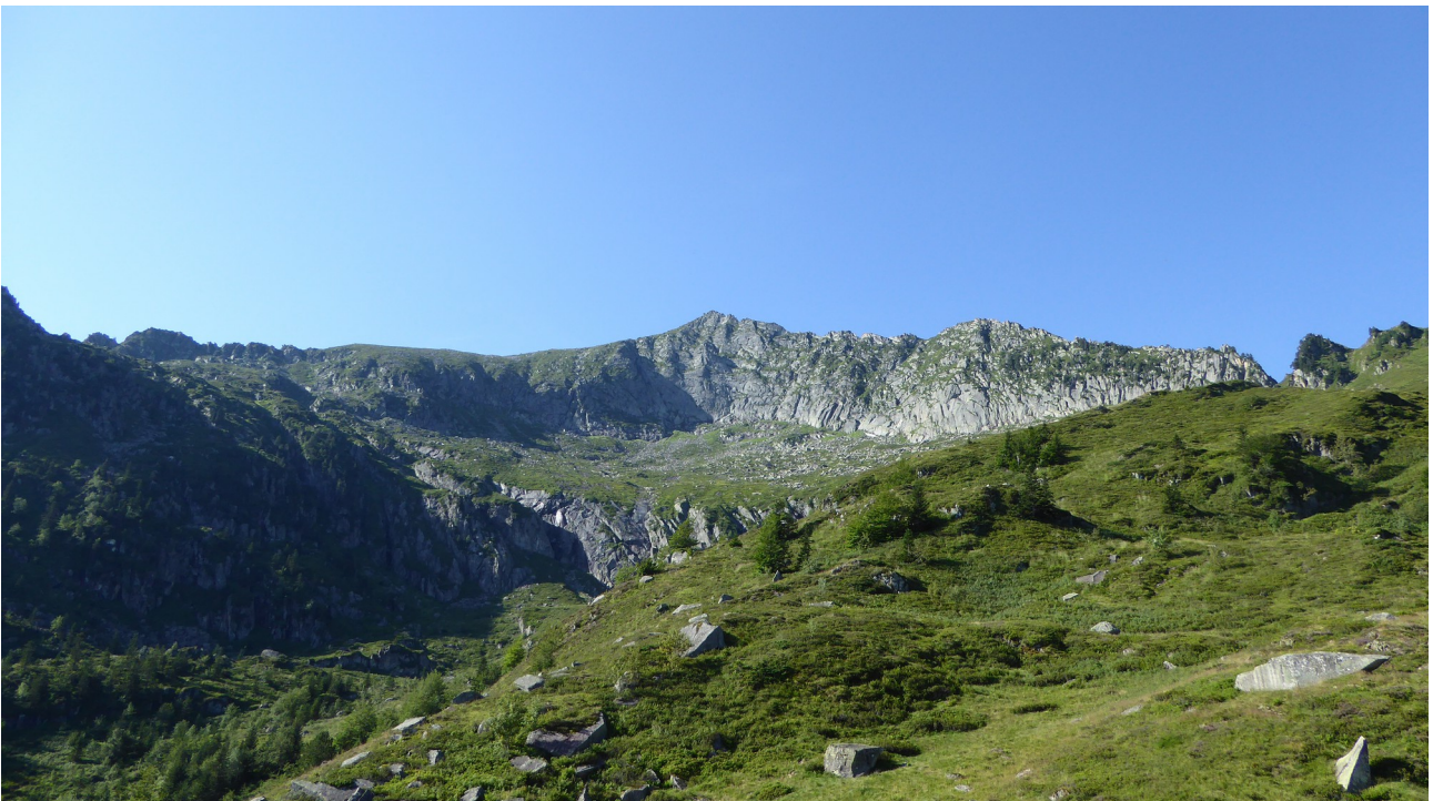
p11 Pic de Mont Rouge

Cette estive est essentiellement constituée de pelouses, de landes et de sapins clairsemés. Elle est dominée au sud par la présence imposante du pic de Mont Rouge à partir duquel s'étire une ligne de crête qui ferme la partie occidentale de ce site.