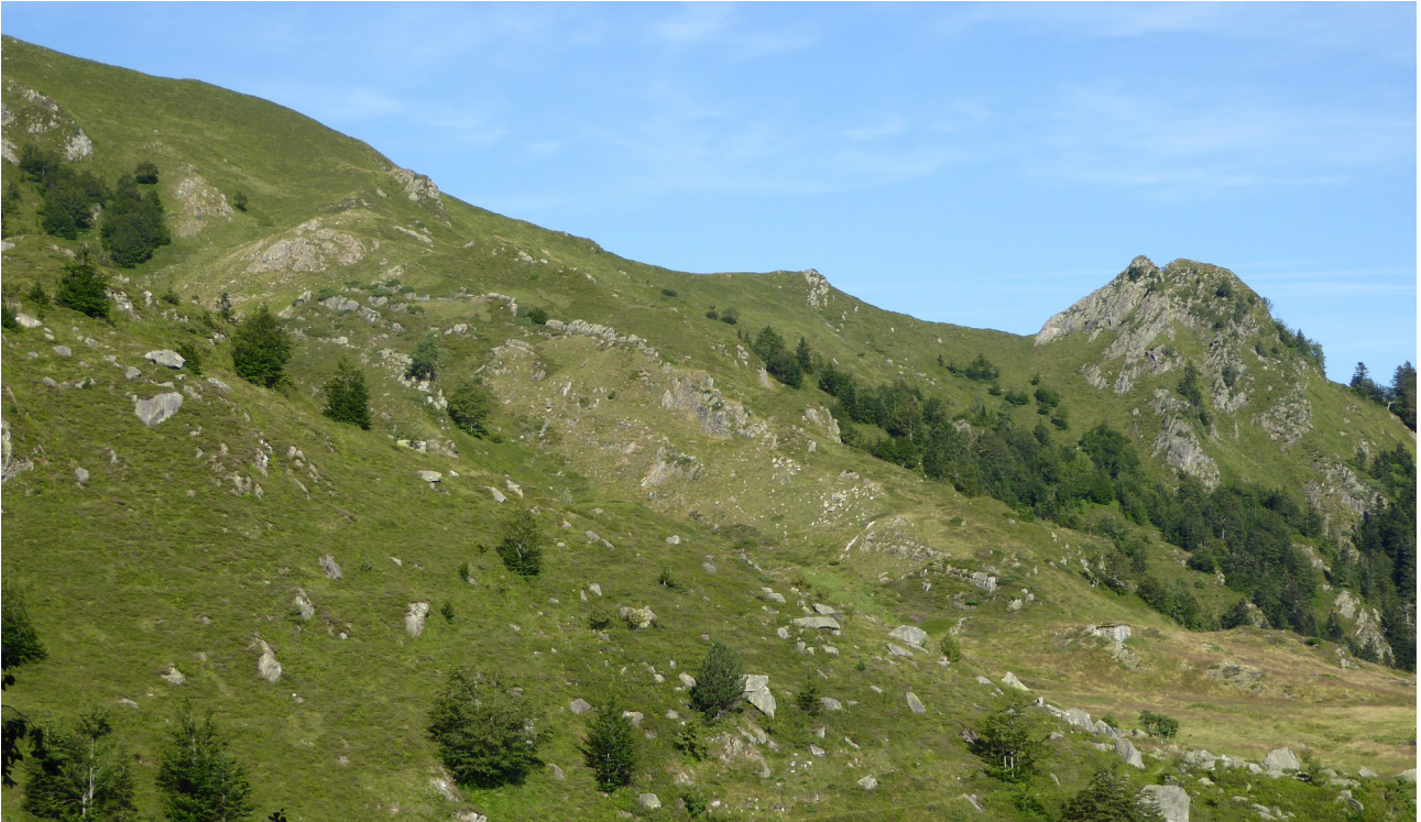
p10 Estive et cabane de Guzet

Peu après avoir passé la fontaine de Fontarech la vue s'ouvre sur la zone d'estive de Guzet.