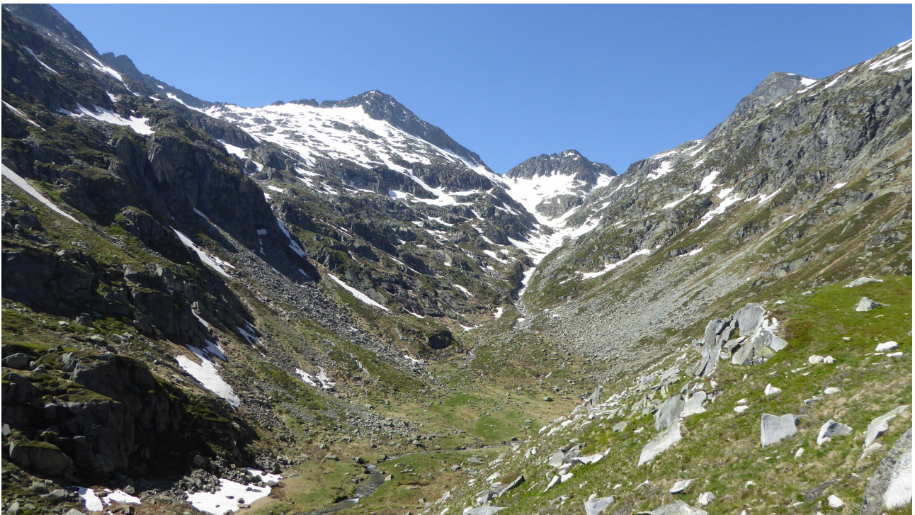
p7 La partie supérieure de la haute vallée d'Ars et ses sommets frontaliers avec l'Espagne

Sur le versant est de cette vallée à mille huit cent cinquante mètres d'altitude la présence des trois orris du Turon d'Ars, dont un récemment restauré, témoigne de l'activité pastorale qui s'y est exercée.