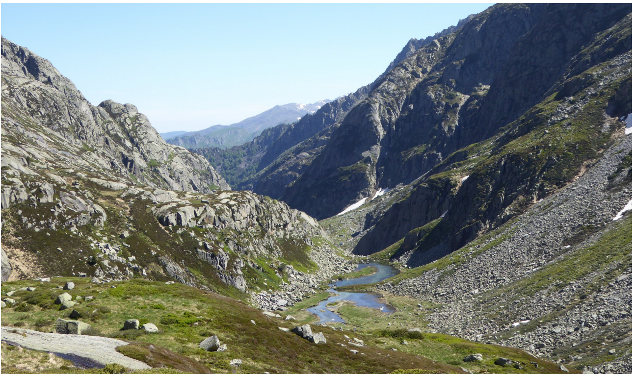
p6 Étang de la Hille de la Lauze