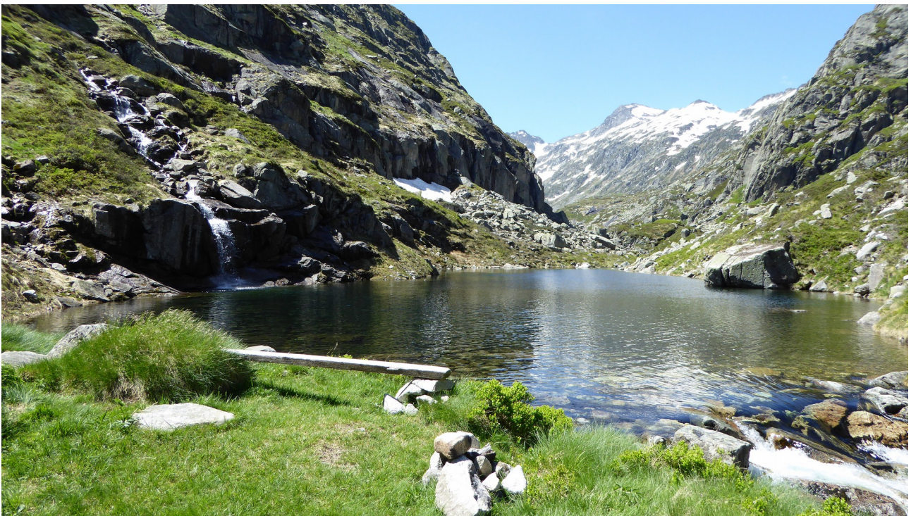
p4 Étang de Cabanas

Le premier étang rencontré est celui de Cabanas qui offre une belle vue vers le sud en direction des hauts sommets.