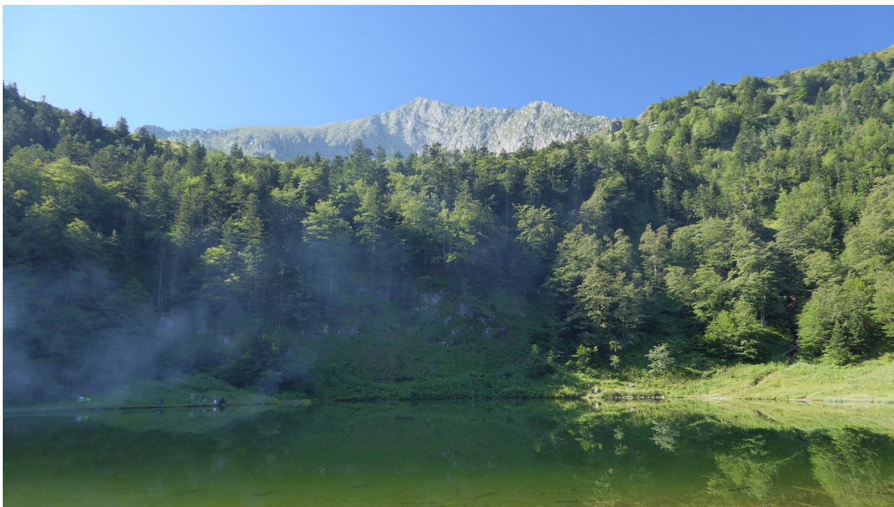
p12 Étang de Guzet

En aval de cette estive, peu après avoir retrouvé la forêt, l'étang de Guzet apparaît, lové dans une sorte de grande cuvette issue de la période glaciaire. Encerclée par la forêt, seule se détache au sud la silhouette imposante du pic de Mont Rouge.