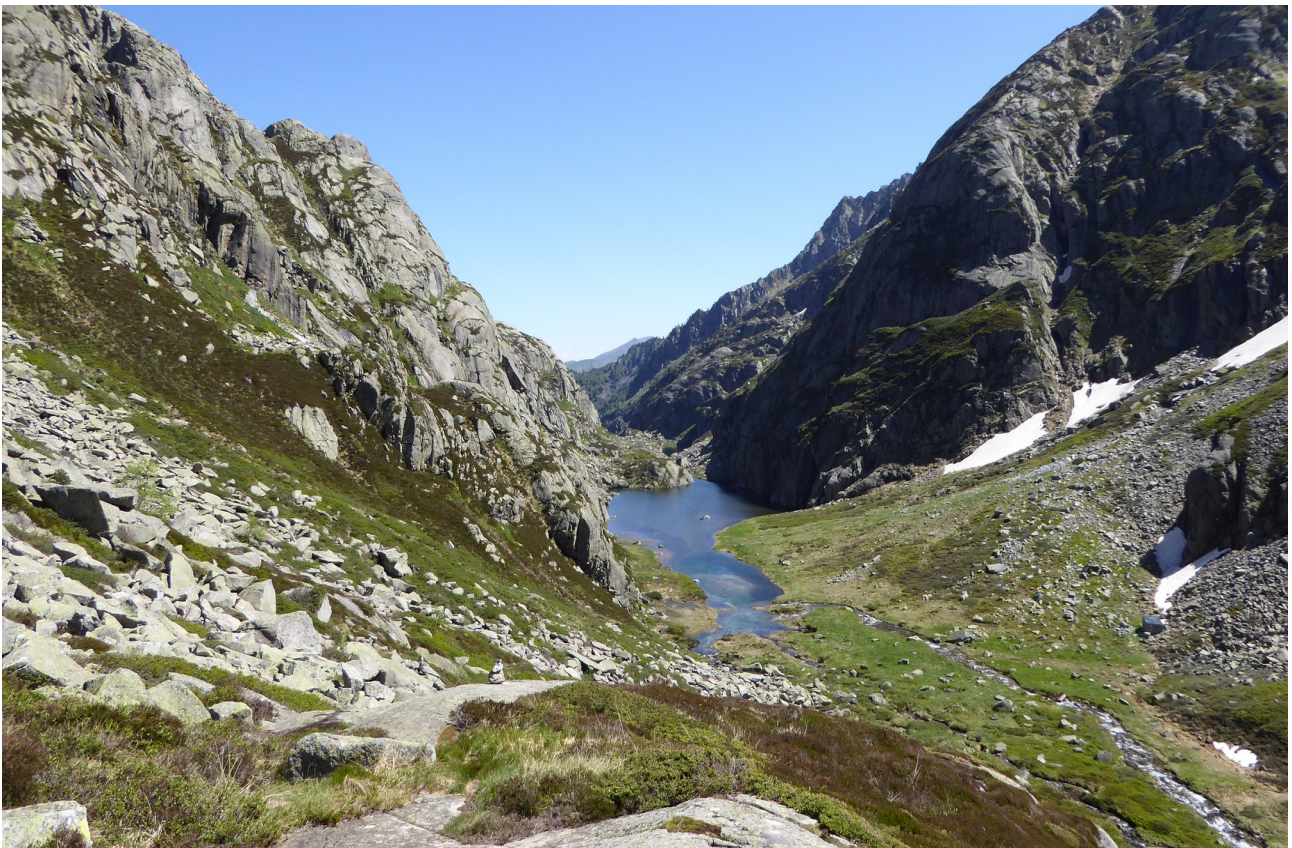
p5 Hille de l'Étang