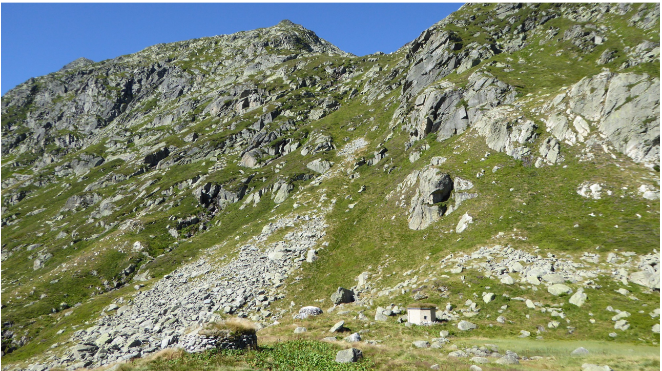
p8 Les orris du Turon d'Ars

Sur le versant est de cette vallée à mille huit cent cinquante mètres d'altitude la présence des trois orris du Turon d'Ars, dont un récemment restauré, témoigne de l'activité pastorale qui s'y est exercée.