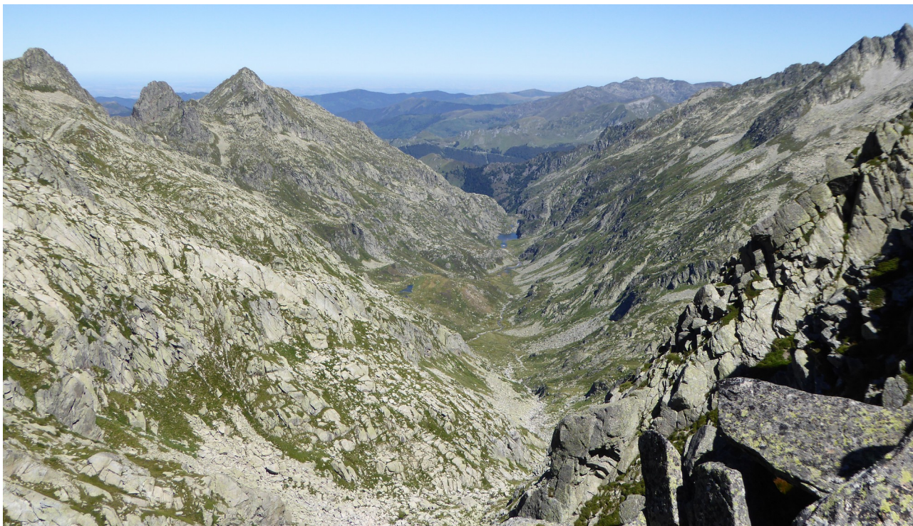
p9 La haute vallée d'Ars depuis le sommet du pic Rouge

La vue depuis le sommet du pic Rouge y est saisissante. Elle permet d'en avoir une vision d'ensemble où les différentes séquences paysagères précédemment décrites se laissent alors admirer.