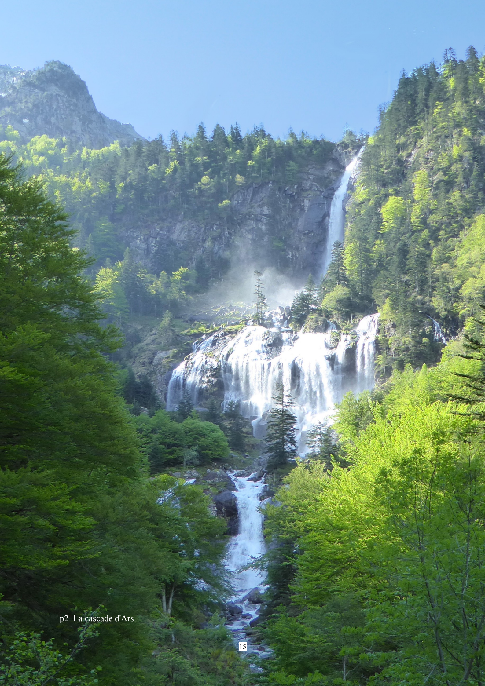
p2 La cascade d'Ars