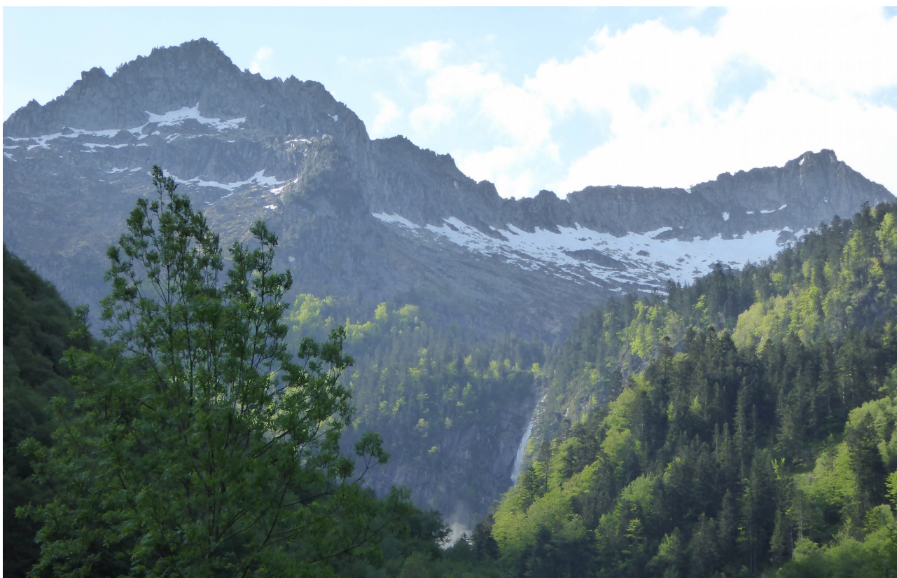
p1 Vue fugitive de la partie supérieure de la cascade à travers bois

Quelques rares ouvertures dans ce secteur boisé permettent d'apercevoir la cascade.