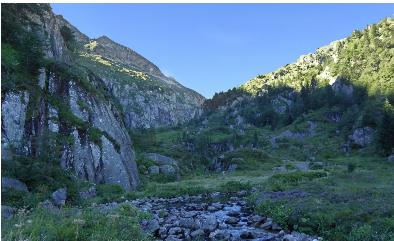
p3 Pla de Pich

A partir de ce secteur dénommé pla de Pich débute la haute vallée d'Ars. Pour y accéder on quitte le sentier de grande randonnée pour filer plein sud. La morphologie héritée de l'épisode glaciaire devient alors bien perceptible.